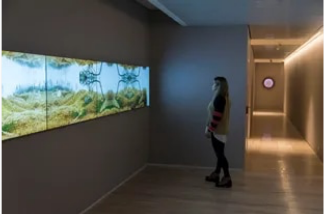
Vista de la videoinstalación de Juan Solanas, con obra de Karina Peisajovich al fondo del pasillo Santiago Cichero – AFV

La elección de los artistas que realizaron obras site specific en dos edificios espejados estuvo a cargo de Costantini, fundador del Malba y coleccionista desde hace más de cuatro décadas, que posee la obra más cara del arte latinoamericano comprada en subastas: el año pasado pagó 34,8 millones de dólares en Sotheby's por Diego y yo , pintura de la artista mexicana Frida Kahlo .