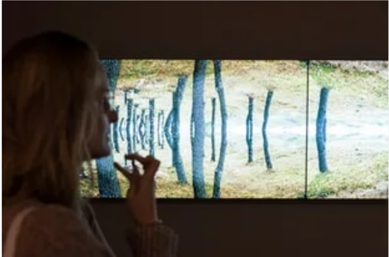
Detalle de la obra de Solanas, inspirada en la proximidad de las torres Oceana con la reserva natural y el río