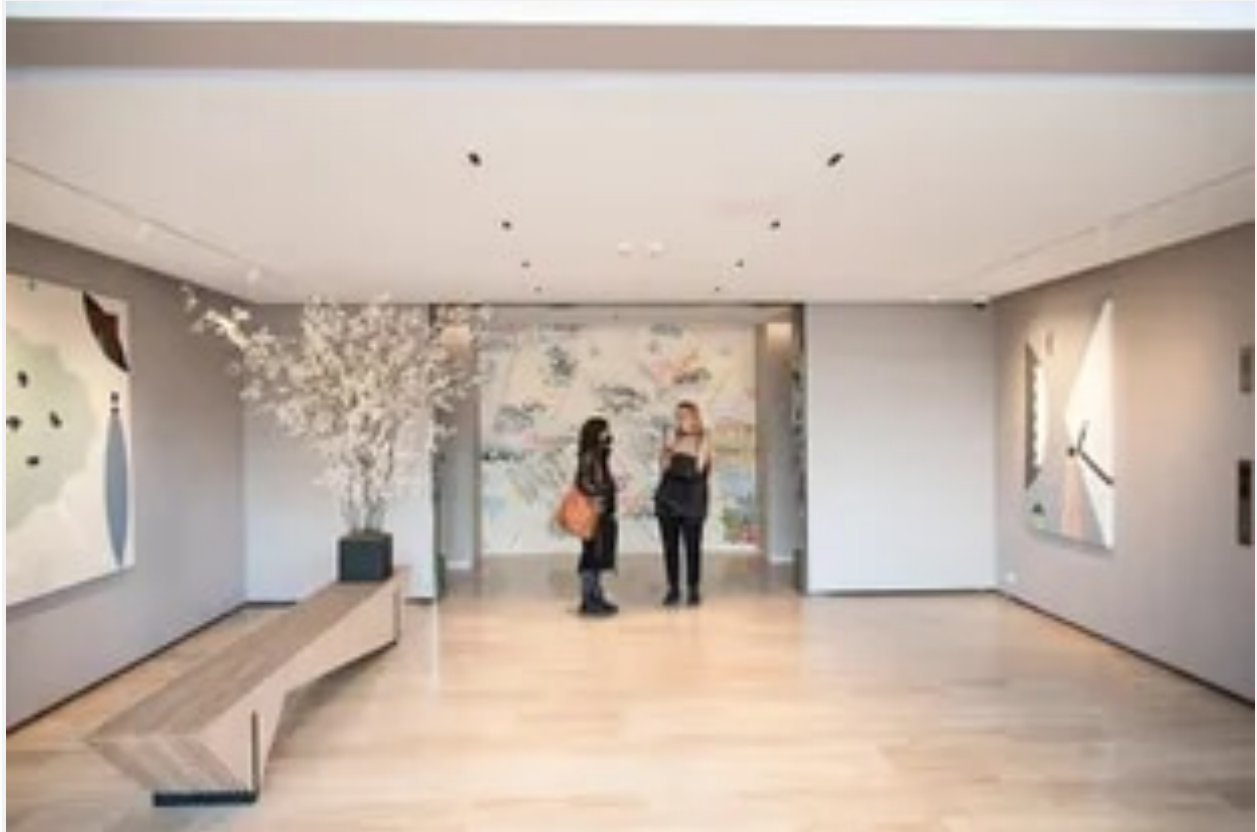
Al fondo, rodeada por las pinturas de Goldstein, la obra de Alejandra Seeber evocan atardeceres, algas gigantes y olas

En los lobbies de ambos edificios , como ya es tendencia desde hace tiempo en Buenos Aires , reciben móviles con circunferencias de aluminio en tonos grises realizados por Joglar. Inspirados en el sistema solar, los planetas y sus órbitas, proponen según el artista “la posibilidad de un cambio de estado, de un cambio de clima . Como si la obra fuese ese contacto, un corrimiento hacia otro aire, hacia un lugar para descansar ”. También hay pinturas de Seeber -evocadoras de atardeceres, algas gigantes y olas-, Lanzi y Goldstein. Esta última presenta atractivas telas caladas con figuras abstractas, recreaciones de una pieza site-specific realizada para el Teatro de la Ribera en 2019, muy diferentes de su conocida producción de figuras de cerámica.