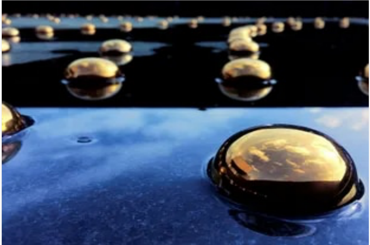
Detalle de la instalación de Battistelli, que reflejará el Cielo